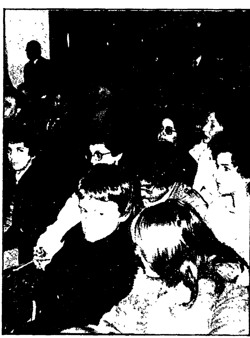
Un aspetto della sala gemita di giovani, durante il dibattito con il dottor Meucci l'altro ieri ad Ancona

Il volto nuovo con il quale si presenta «l'emarginazione giovanile» — La ricerca di una identità — Un'aggressività troppo spesso e a torto repressa — Il ruolo della famiglia e della società