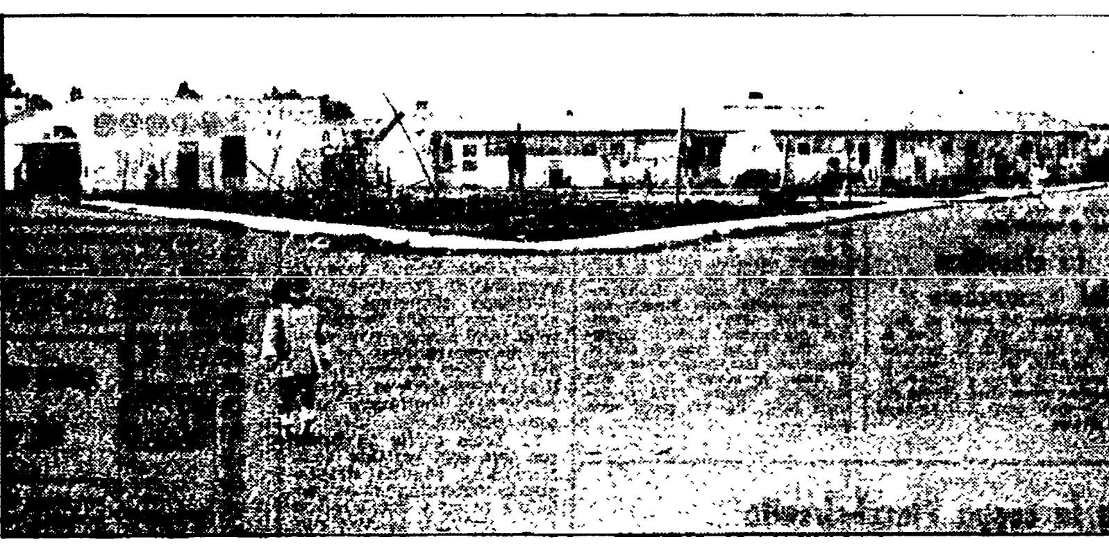
Un'immagine della periferia di Brindisi: squallore e abbandono