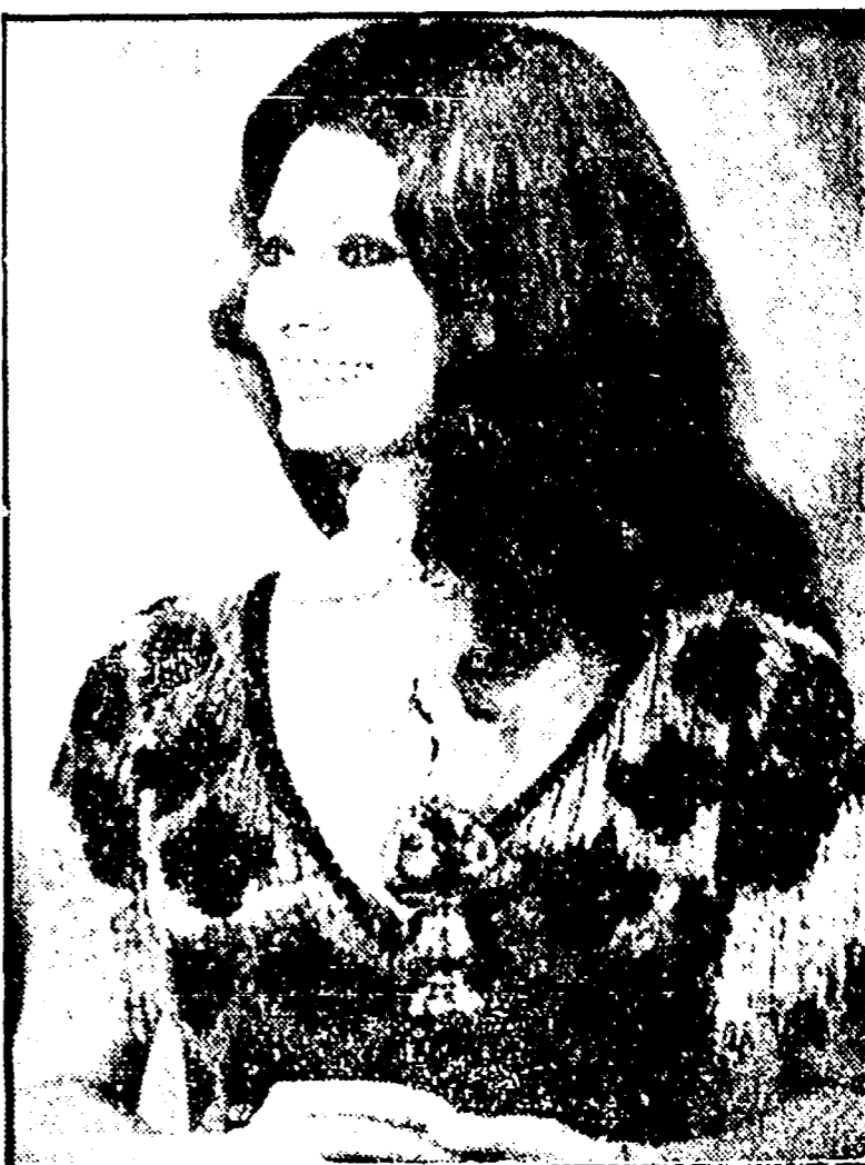
Sophia Loren in una foto scattata l'anno scorso, in occasione di una premiazione negli Stati Uniti

È durata tutta la notte la via vai di ufficiali della guardia di finanza, giornalisti e fotografi all'aeroporto di Fiumicino, dopo che in serata si è diffusa la notizia del fermo di Sophia Loren. L'attrice, qualche minuto prima delle 20, mentre si preparava ad imbarcarsi, è stata fermata da un agente della Guardia di finanza.