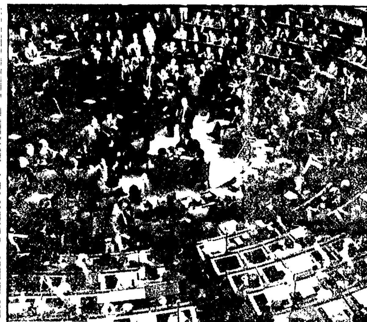
(Dalla prima pagina)

Adidentari incredibili la reazione di Gu, anche tenendo conto di un comunisti che non trova un compagno di coglimento, che si è tolto il cappello e ha urlato: «E' un atto di infamia».