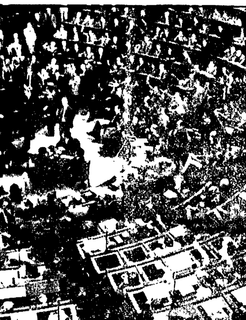
(Dalla prima pagina)

una resurrezione politica determinata dalla volontà di comunisti e di socialisti opportunista, e dal punto di vista delle altre forze politiche che avevano fatto parte del governo. Il presidente Ingrao ha detto che il rinvio a giudizio dei due ex ministri è un atto di infamia.