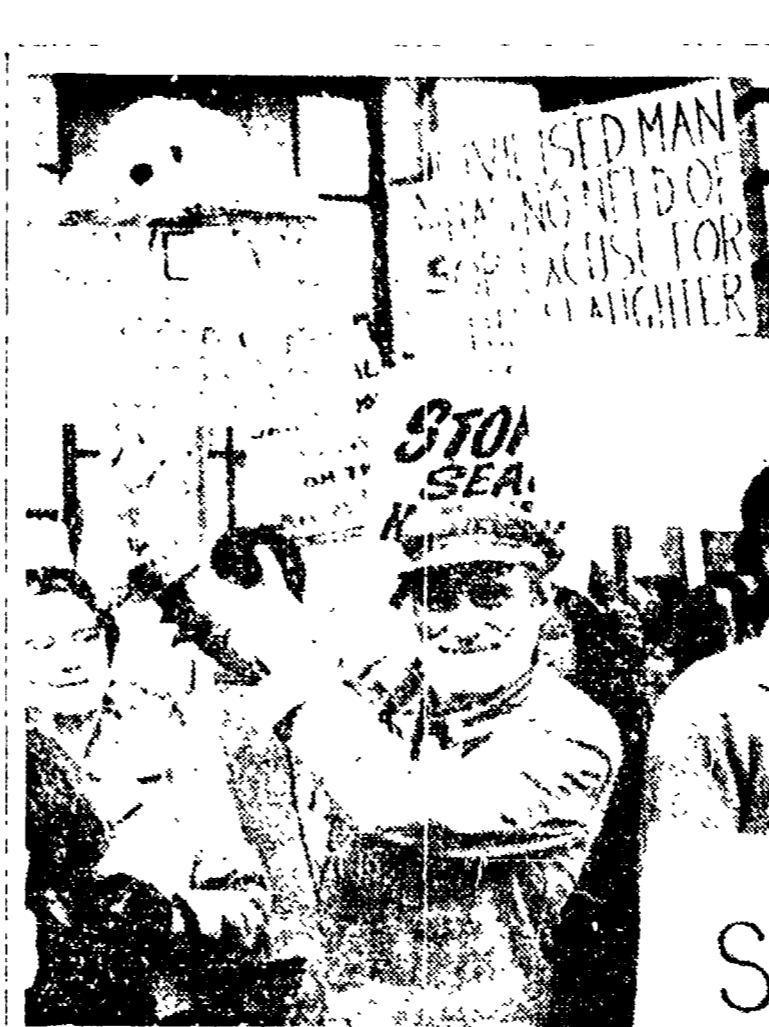
PROTESTA PER SALVARE LE FOCHE LONDRA - Circa 250 persone hanno inscenato una manifestazione di protesta davanti all'Ambasciata canadese e nevicata per chiedere una protezione per le foche che vivono lungo le coste di quel Paese. In una petizione i manifestanti hanno sollecitato provvedimenti contro gli uccisori dei piccoli delle foche. Nella foto: l'attore Spike Milligan mentre innalza un cartello di protesta durante la manifestazione.

CATANZARO - Per la quarta volta oggi il silenzio tornerà ad aprirsi a Catanzaro. Prognostica l'assalto di Giannettini contro i due imputati, Freda e Ventura, che si sono chiusi nel silenzio. Giannettini, che è stato arrestato il 26 gennaio scorso, è stato quindi trasferito in carcere il 27 gennaio. Il suo processo è stato fissato per il 28 gennaio. Giannettini, che è stato arrestato il 26 gennaio scorso, è stato quindi trasferito in carcere il 27 gennaio. Il suo processo è stato fissato per il 28 gennaio.