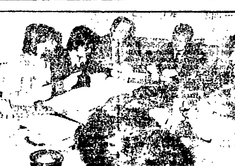
Riunito il direttivo del PCI ternano

PERUGIA — In Umbria, nel 1977, si prevede un deficit di 4 miliardi di lire. La situazione finanziaria è pesante a causa dei vertiginosi aumenti dei costi di gestione e dell'assenza di una politica di ristrutturazione a livello nazionale. Nonostante ciò, si ritiene che i frutti siano positivi.