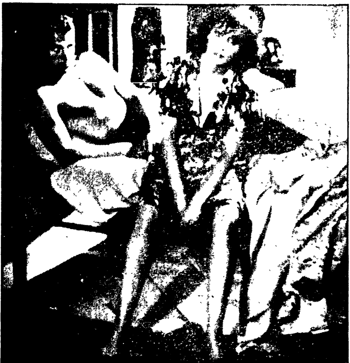
Massimo Girotti e Clara Calamai in una scena di « Ossessione »

« A questo lavoro mi ha portato soprattutto l'impegno di raccontare storie di uomini vivi: di uomini vivi nelle cose, non le cose per se stesse »