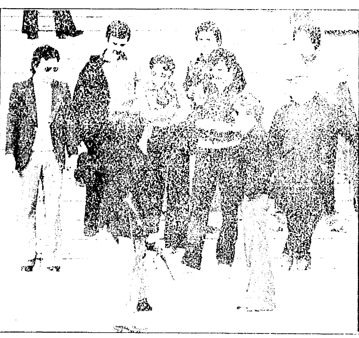
Giovani dell'istituto nautico a colloquio con un agente dopo l'assalto della squadrista fascista

Insultati e picchiati con spranghe e sassate alcuni giovani che stavano entrando nell'istituto tecnico dove si doveva tenere un'assemblea - Un proiettile ha forato una gomma di un'auto di passaggio - Gli agenti hanno risposto con raffiche di mitra in aria - I due rinchiusi in carcere dovranno rispondere di concorso in tentato omicidio - Aggressione anche al «Righi» - Presa di posizione della Federazione del PCI