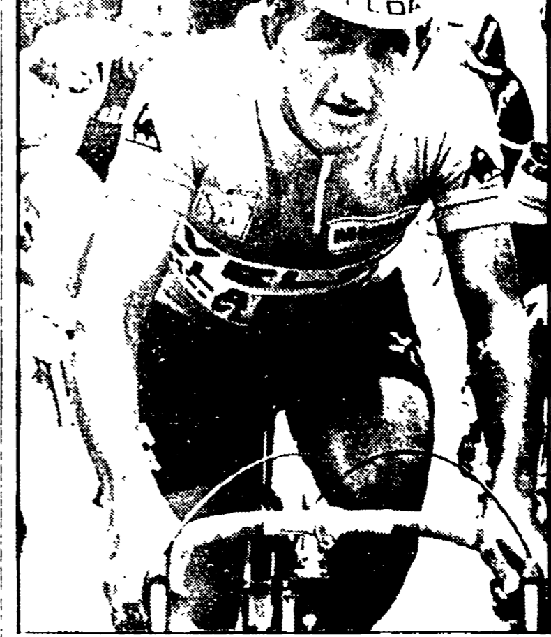
NELLA FOTO: Maertens

Se prendono il vento e il sole del mattino, c'è un'ottima possibilità di vittoria per il belga Merckx, che ha vinto la Milano-Sanremo nel 1973.