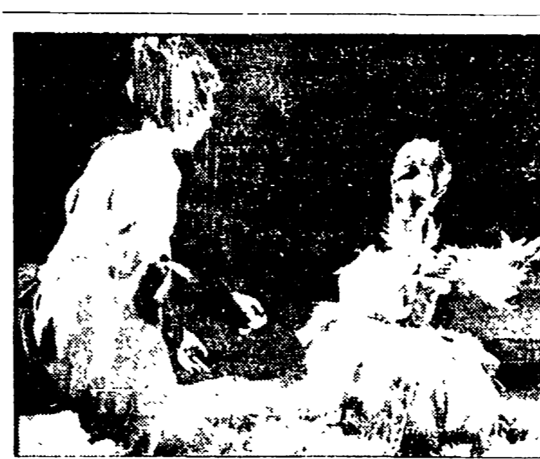
Le marionette di Salisburgo a Perugia con « Il flauto magico » e « Il barbiere »

Muoversi in questa direzione significa inoltre dare un contributo alla risoluzione dei grandi problemi nazionali dell'organizzazione della nostra bilancia dei pagamenti, occupazione, ricerca scientifica, riforma dell'università. In questo quadro va inserita la necessità di definire anche il ruolo del medico veterinario, che non dovranno essere in futuro solo addetti alla cura e alla macellazione dell'animale, ma dovranno interessarsi anche allo studio ed alla selezione delle razze, alla loro adattabilità all'ambiente, alle tecniche di allevamento più produttive.