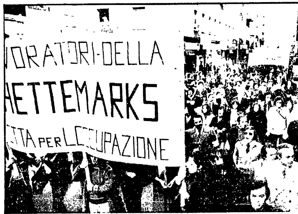
Il corteo nelle vie di Bari