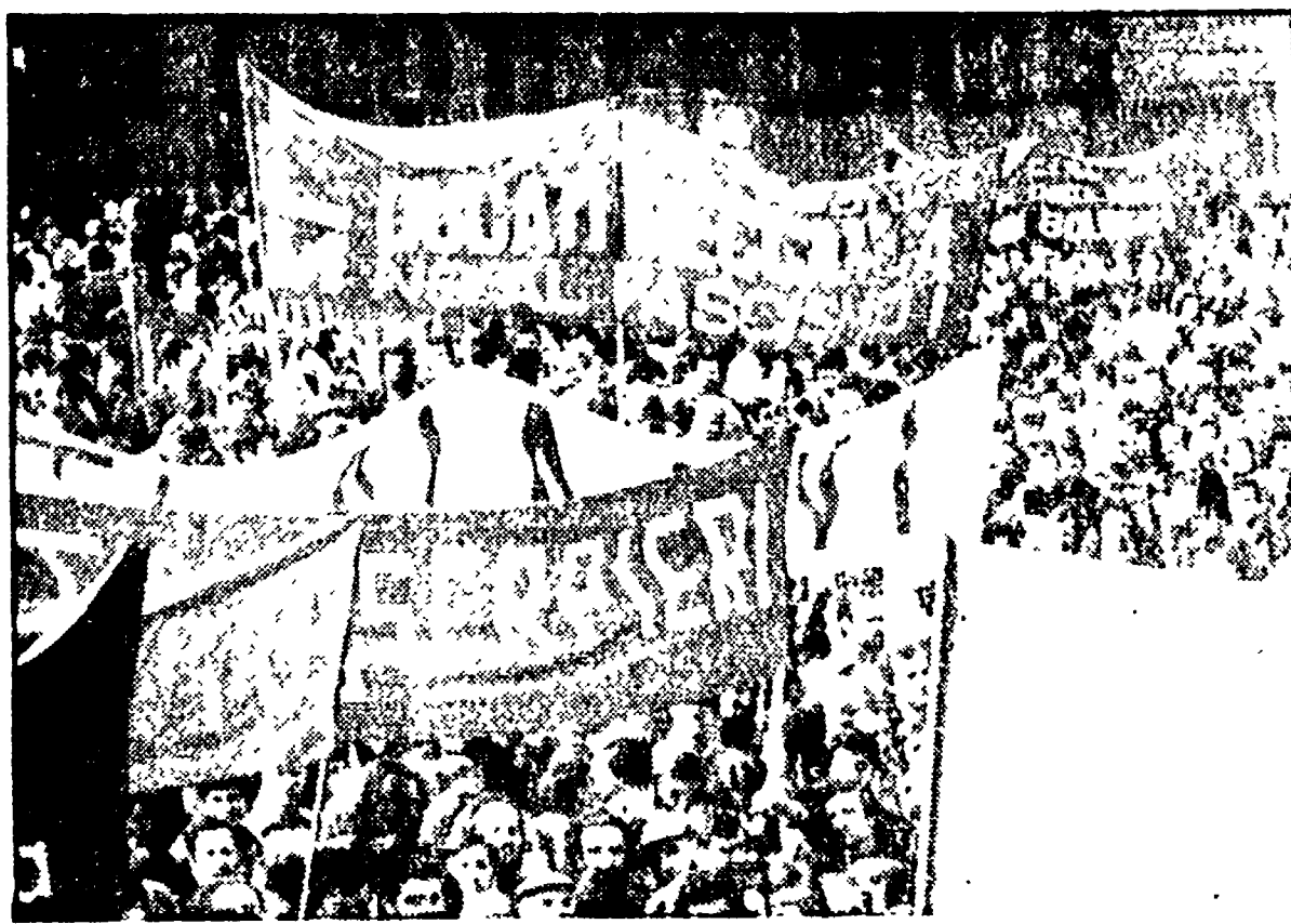
La manifestazione a Bologna