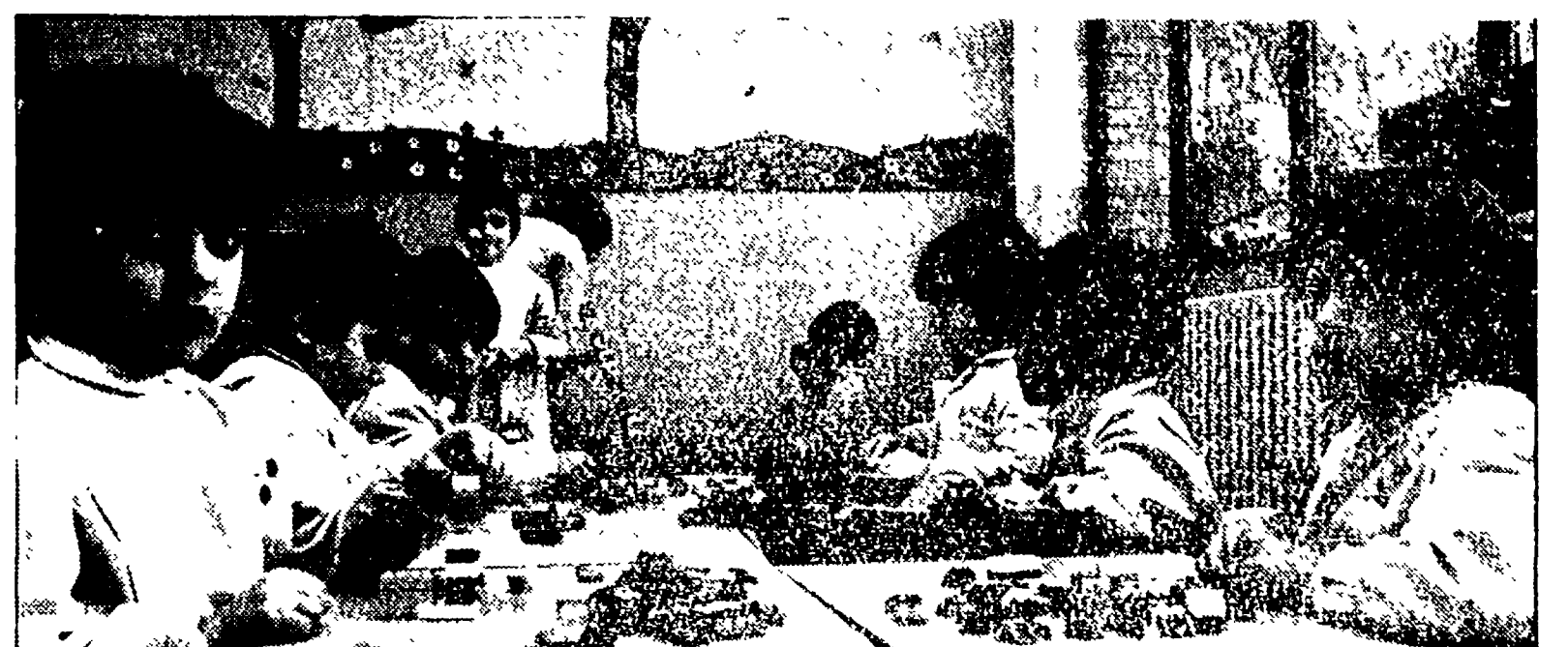
Bambini mentre giocano in una scuola di Fano

Per la prima volta i cittadini, discutendone in assemblee le modalità, pagheranno una quota per le materalne. Un'attenzione continua per i problemi della educazione e dell'infanzia - Si lavora per il progetto di «Scuola aperta»