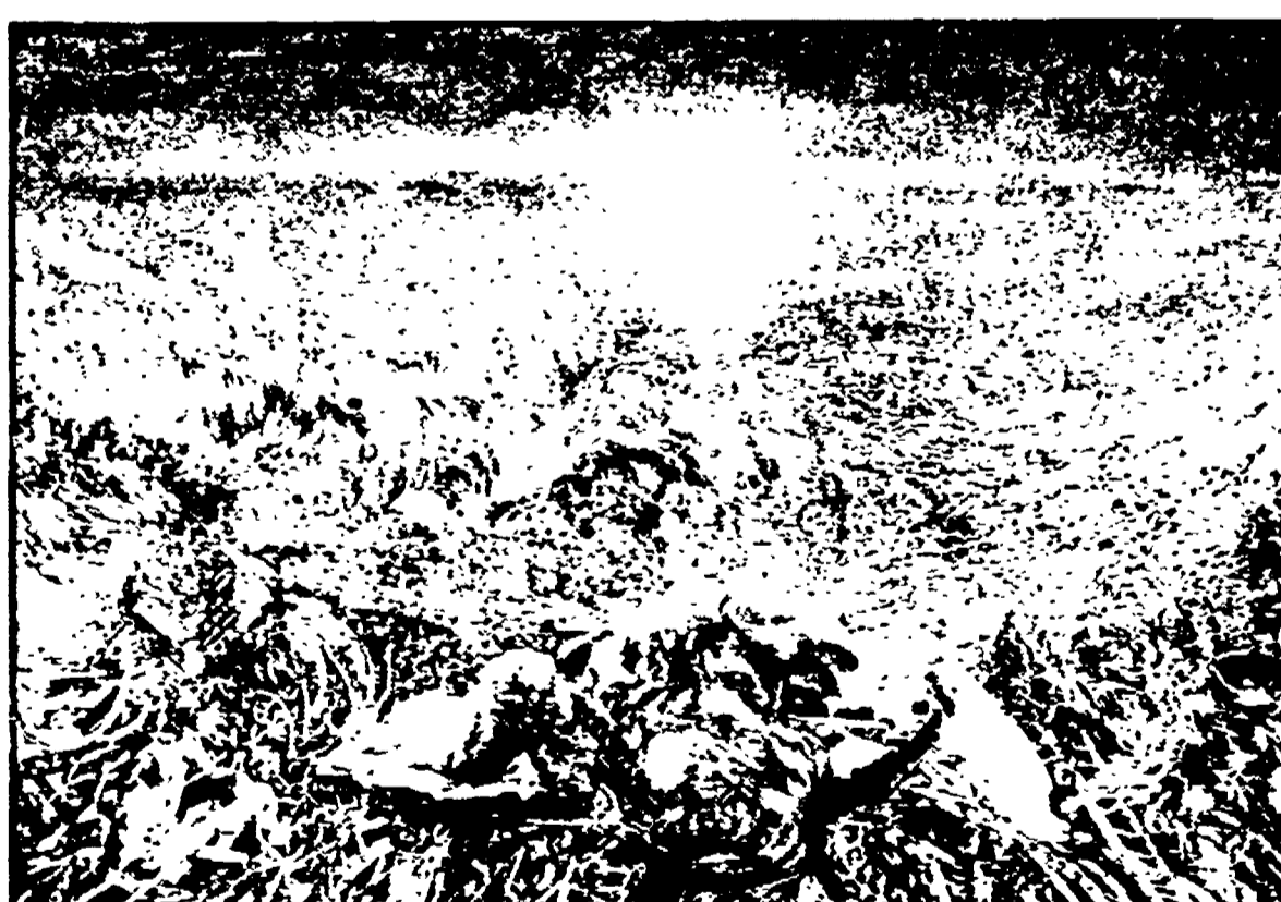
Una delle opere esposte di Jean Pierre Velly