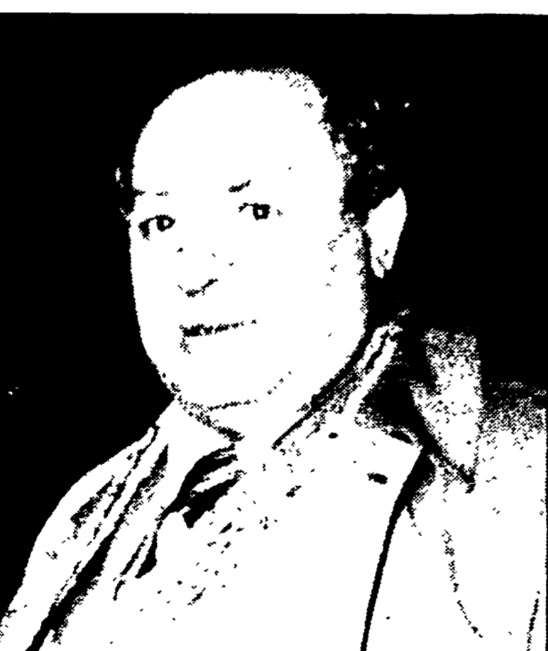
Portrait of a man, likely related to the article 'Eletto con i voti di PCI, PSI, PRI, PSDI, DC e PLI'.