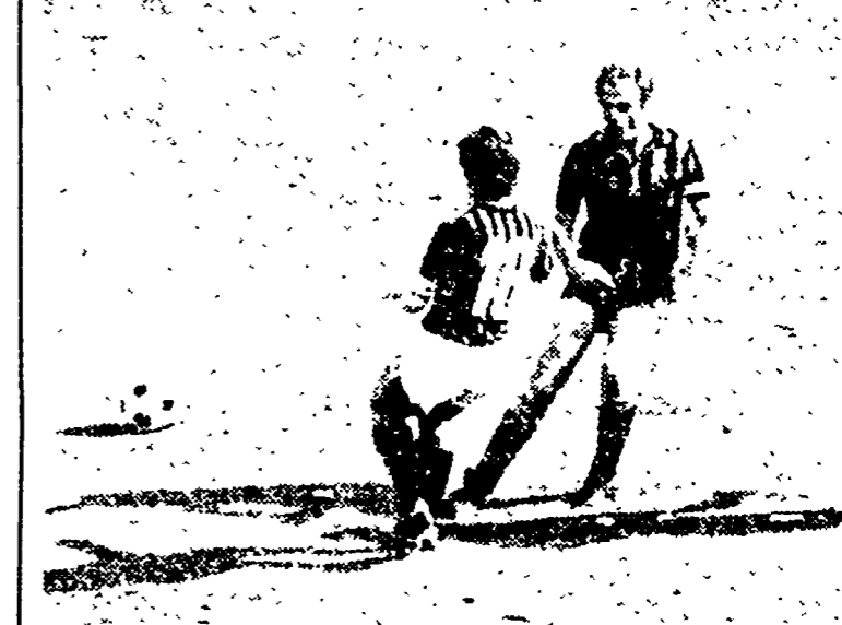
Ombre lunghe per Mazzola e Rivera e l'ora del tramonto con la palla lontana

«Costi» sono i nomi di un'operazione di marketing. I dirigenti di una società si rendono conto che il loro prodotto non è conosciuto e decidono di lanciarlo. I cosiddetti sono i nomi di un'operazione di marketing. I dirigenti di una società si rendono conto che il loro prodotto non è conosciuto e decidono di lanciarlo.