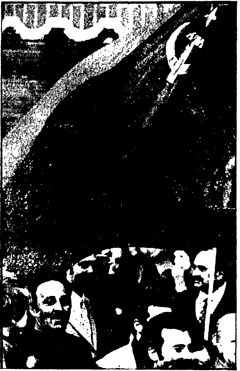
Una manifestazione del partito nella regione