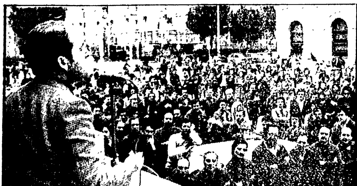
Un'immagine dell'assemblea di ieri alla Terni

Nell'incontro di Roma l'azienda ha assicurato nuove produzioni - Previsto uno sciopero degli operai