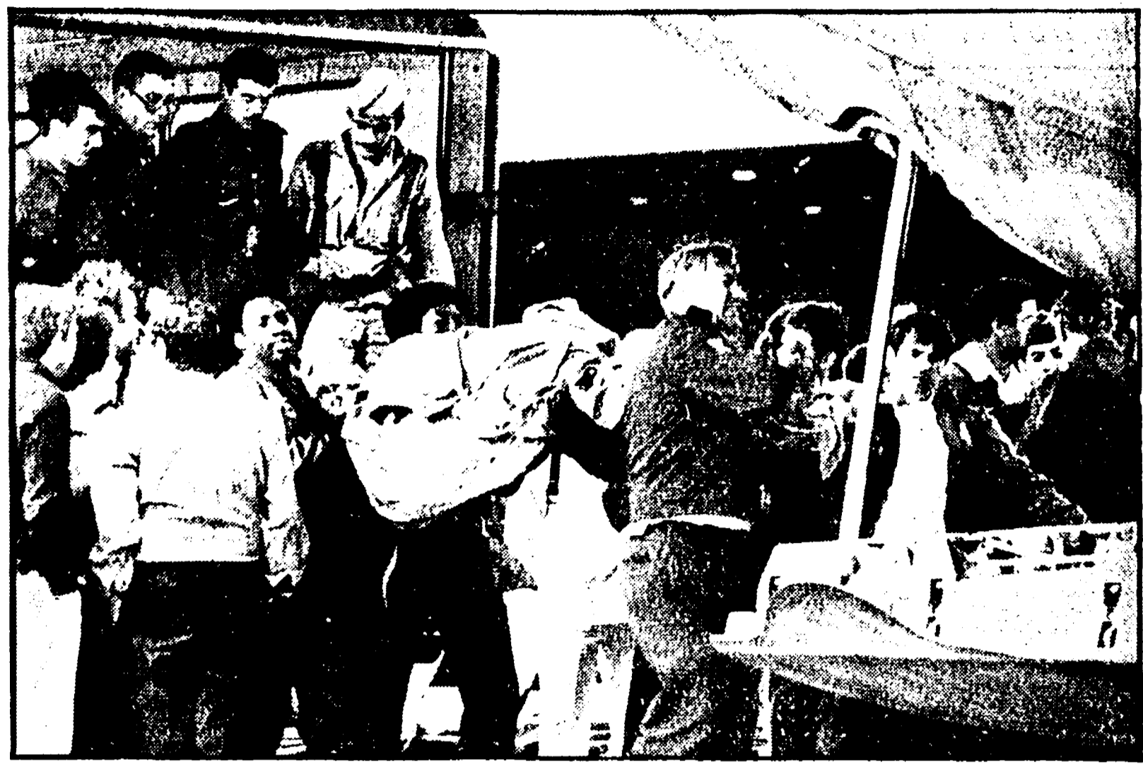
Salite a 578 le vittime dei due «Jumbo»

SANTA CRUZ DI TENERIFE — Per un errore di calcolo, un passeggero si è re-pensato del disastro aereo che domenica, sulla pista dell'aeroporto di Santa Cruz, ha causato il maggior numero di vittime in assoluto per una catastrofe aerea. È stata la prescrizione del pilota olandese, nell'ordine di marcia di decollo, a determinare la catastrofe o la mancata esecuzione da parte del collega americano di una manovra impartita dalla torre di controllo. Su queste due ipotesi, in assenza di elementi probanti inconfutabili, la controversia fra i funzionari della compagnia di bandiera olandese e quelli della aviazione americana divampa e si