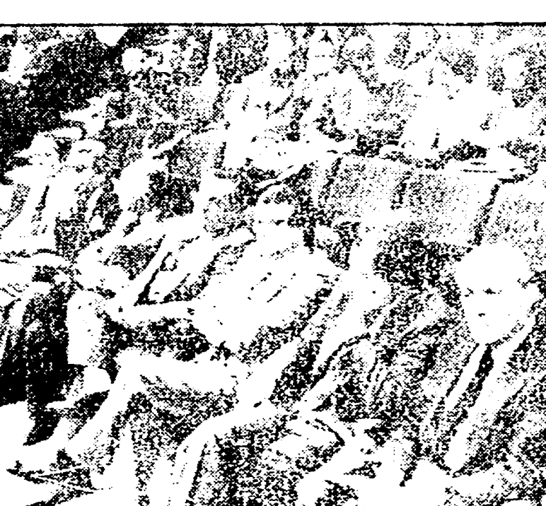
Esponenti degli altri partiti democratici seguono a lavoro