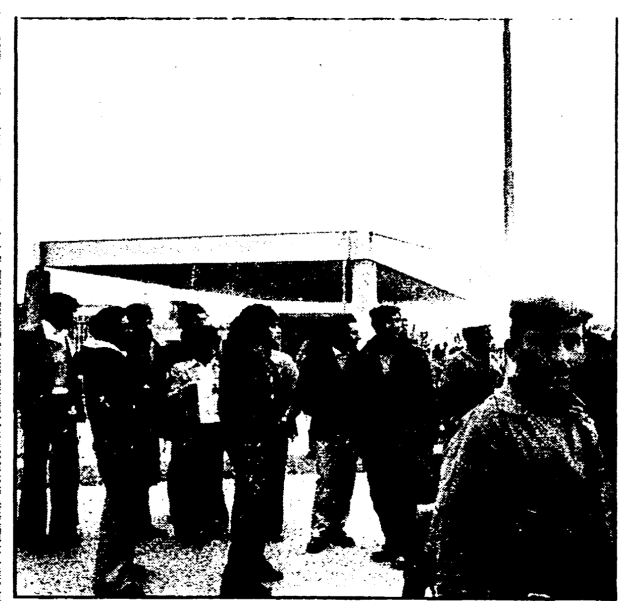
Lavoratori della Chimica del Tirso all'uscita dallo stabilimento