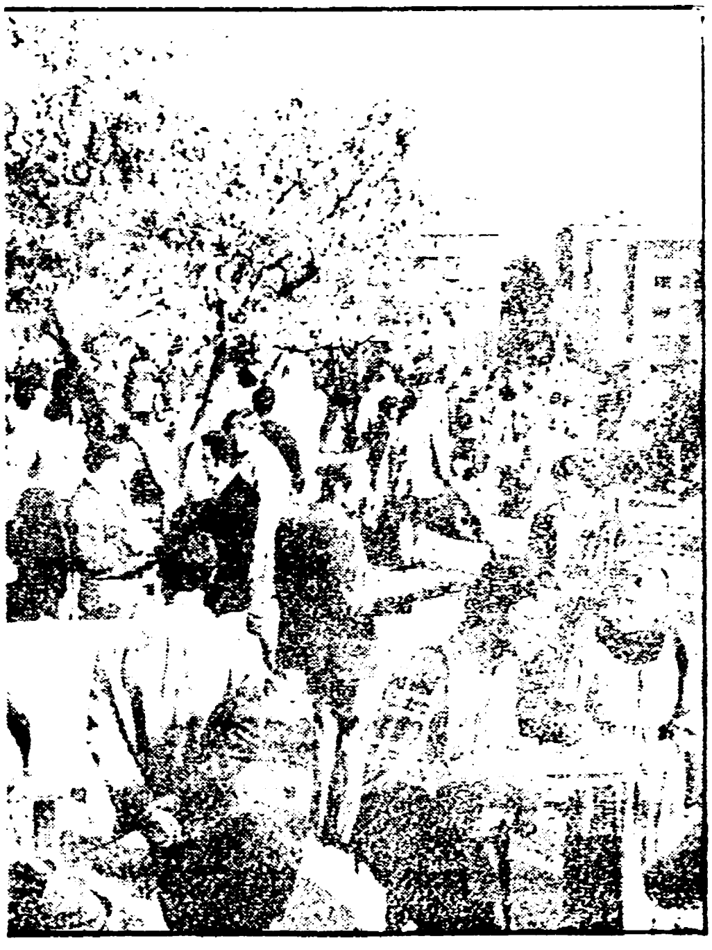
La manifestazione dei cittadini a Villa Flora