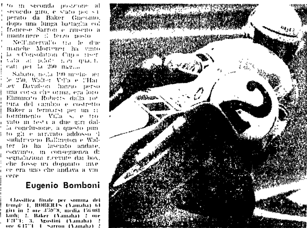
IMOLA - Kenny Roberts in azione nella vittoriosa 200 miglia.