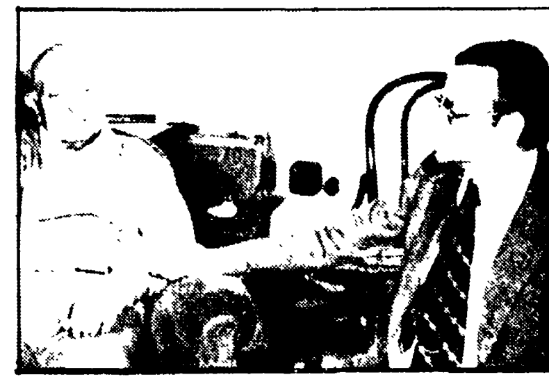
Nessun ostacolo sulla loro strada