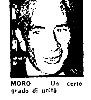
MORO - Un certo grado di unità