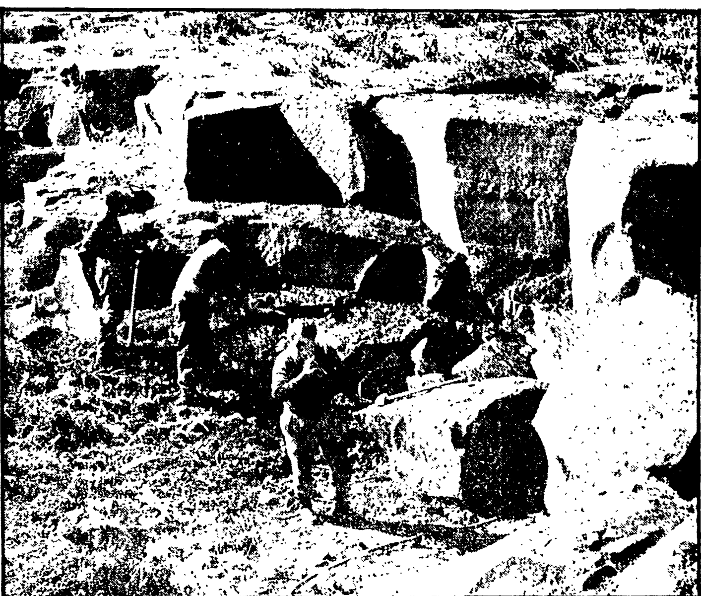
ALES — Si lavora attorno a blocchi di pietra per il monumento a Gramsci