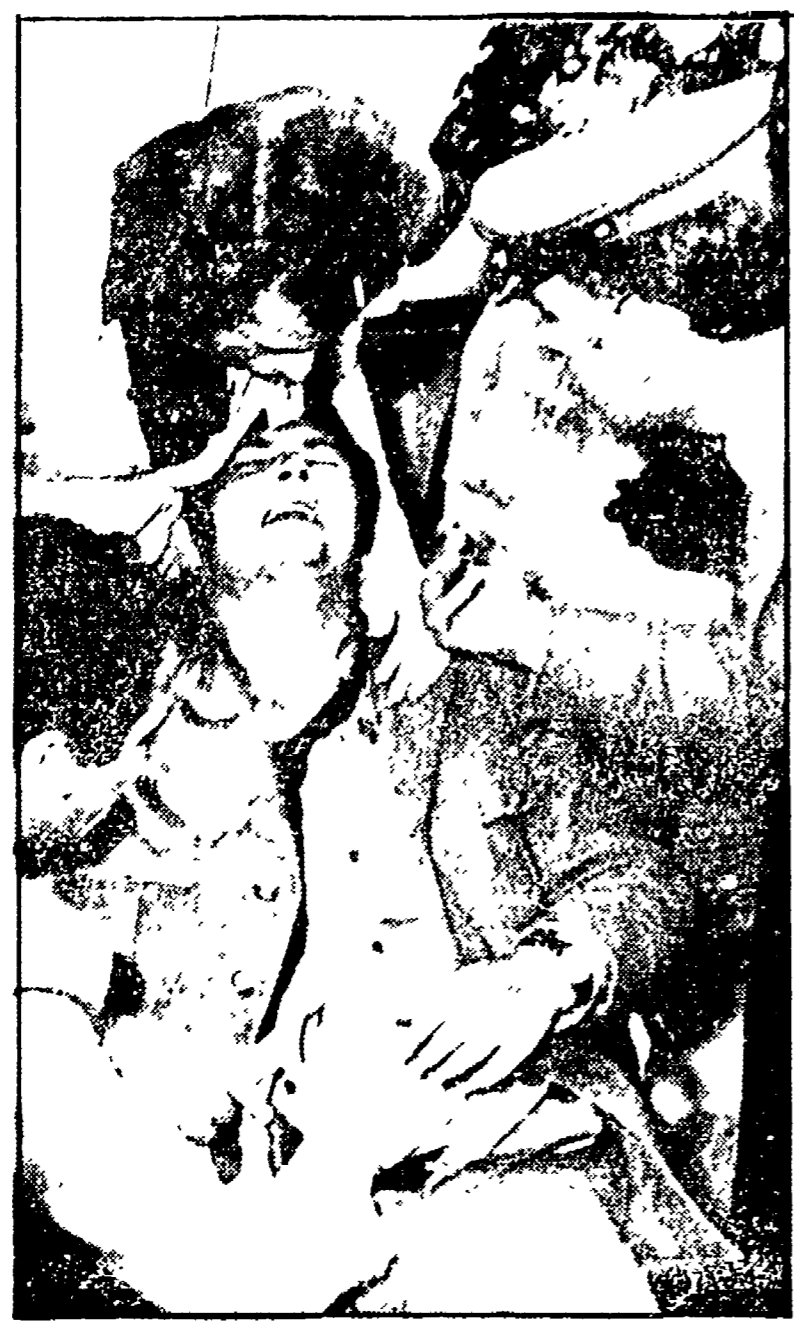
Un agente di custodia ferito durante la rivolta nel carcere di Alessandria, prima del referendum sul divorzio

In queste immagini una donna di custodia di casto di un carcere, in un momento di protesta contro la violenza in carcere. Su questo problema il « Comitato provvisorio » degli agenti in lotta ha presentato un documento che è stato distribuito in tutto il paese. Il documento è intitolato « Custodi al passo coi tempi contro la violenza in carcere ».