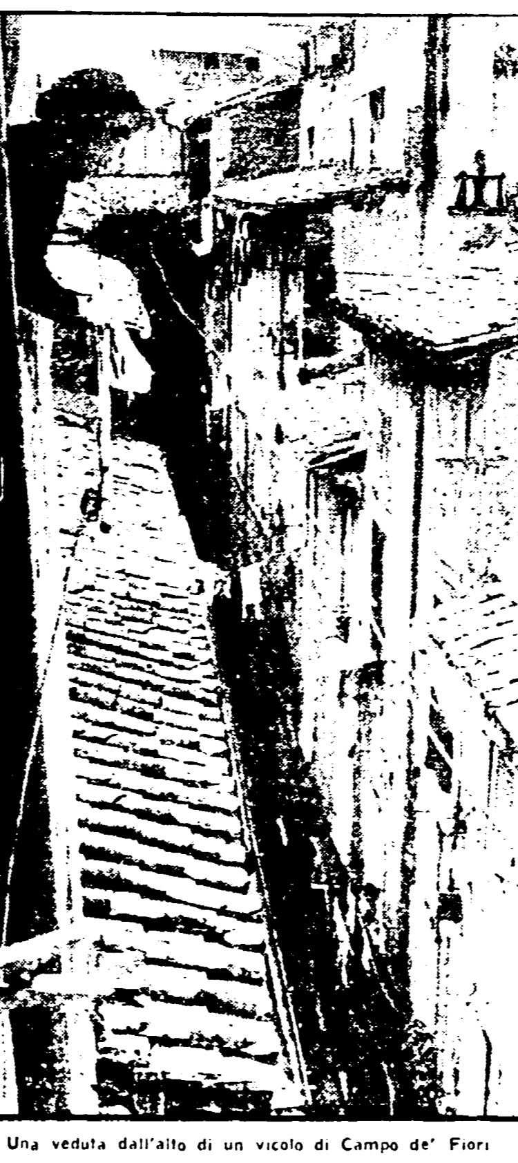
Una veduta dall'alto di un vicolo di Campo de' Fiori

N.B. - Per ogni « semipedonalizzato » si intende lo spazio in cui è vietato per il traffico di automobili e permesso il movimento solo in alcune ore del giorno.