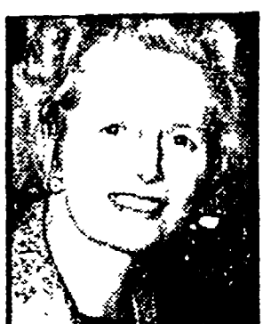
THATCHER — Sulla «impopolarità» del governo