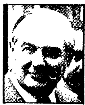
CALLAGHAN — Con l'appoggio liberale