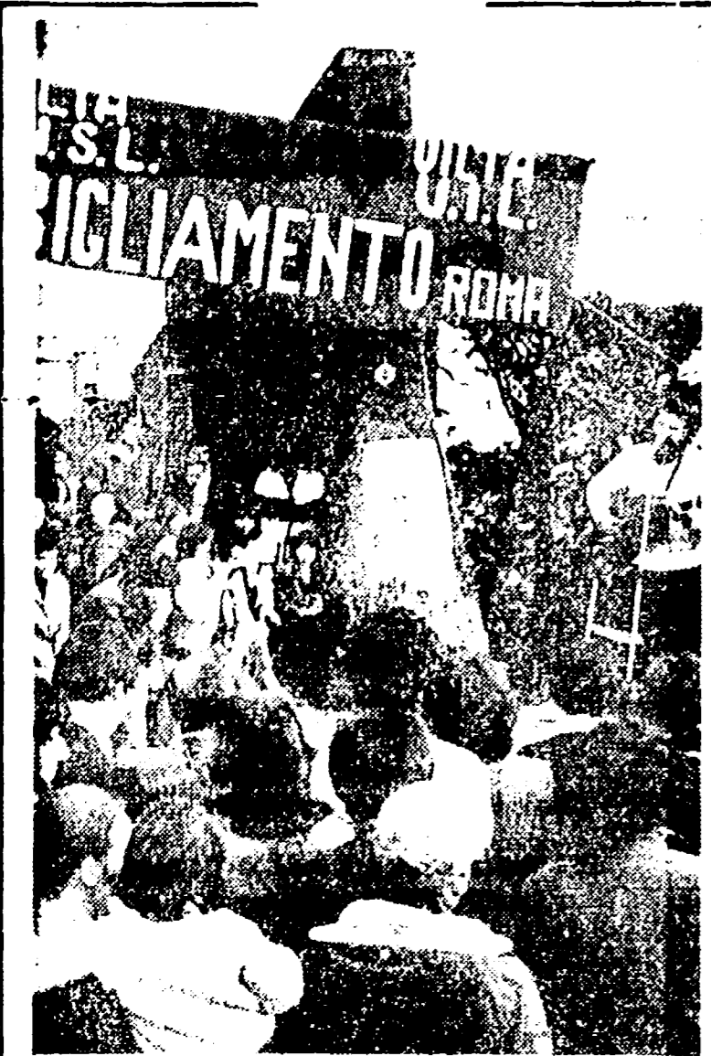
La Pasquetta in fabbrica delle opere della Fezia

Lo sconcertante bilancio meteorologico ha convinto moltissimi a rientrare in città fin dalla prima mattina di ieri - Per allontanarsi almeno un giorno c'è chi ha preferito usare i pullman dell'Acotral - I ristoranti dei Castelli parzialmente affollati mentre a Roma continuavano a girare i turisti