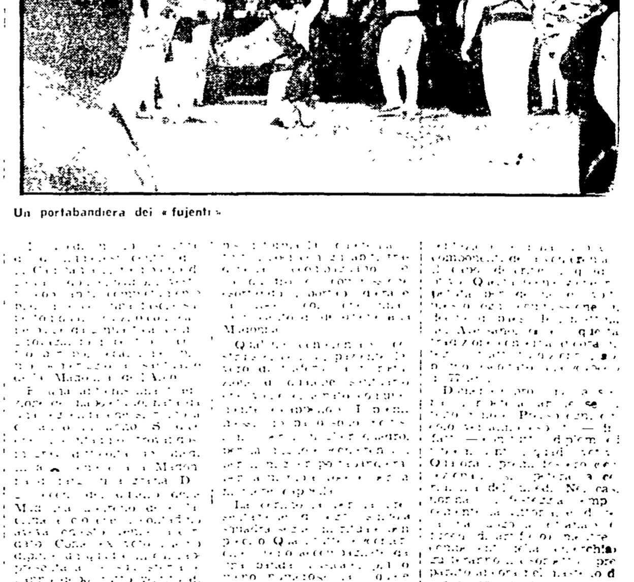
Un portabandiera dei «fujenti»

Centinaia di persone, vestite di bianco, hanno trasportato anche ieri i quadri votivi. Una leggenda all'origine della tradizione. Una leggenda all'origine della tradizione. Domenica prossima, in tono minore, la cerimonia si ripete. La tradizione dei «fujenti» al santuario della Madonna dell'Arco è molto antica. Ogni anno, centinaia di persone si recano al santuario per partecipare alla cerimonia. Le persone che partecipano alla cerimonia sono vestite di bianco e trasportano i quadri votivi. La cerimonia si svolge in un'atmosfera di devozione e di fede. Una leggenda all'origine della tradizione. Domenica prossima, in tono minore, la cerimonia si ripete.