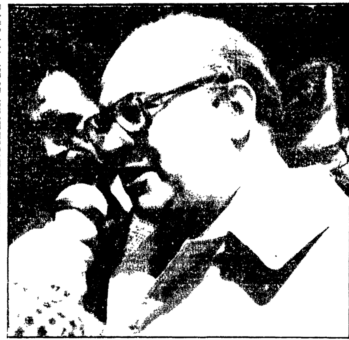
L'onorevole Craxi risponde alle domande dei giornalisti mentre esce da casa De Martino.

Un'atmosfera di attesa, di incertezza, di angoscia, di attesa di un «segnale» che si allenti «la pressione della stampa». De Martino ha detto che la stampa continua a esercitare una forte pressione su di lui e che questa situazione gli causa un certo disagio. Craxi ha promesso di fare tutto il possibile per alleviare questa situazione. Ha detto che parlerà con i dirigenti del Pci e cercherà di ottenere un maggiore rispetto per la privacy di De Martino. De Martino ha ringraziato Craxi per la sua visita e ha detto che si sente un po' più tranquillo. Ha detto che continuerà a seguire il suo corso e che non si lascia influenzare dalle pressioni della stampa.