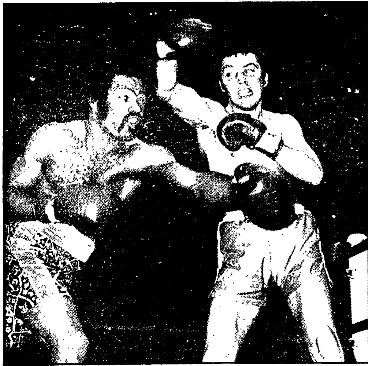
Alan Minter, campione europeo dei pesi medi, è stato battuto prima del limite dallo statunitense Ronnie Harris in un match svoltosi all'Albert Hall di Londra.