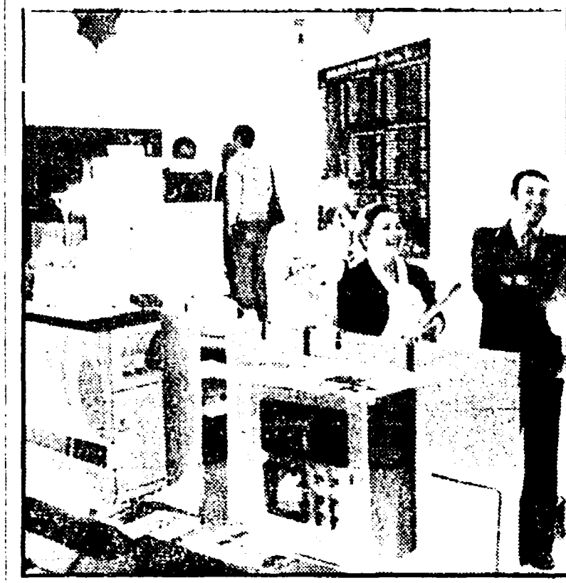
Mostra alla Fiorentina Gas

Illustrate dalla seconda commissione le risoluzioni del consiglio — Affrontati i problemi dei regolamenti comunitari