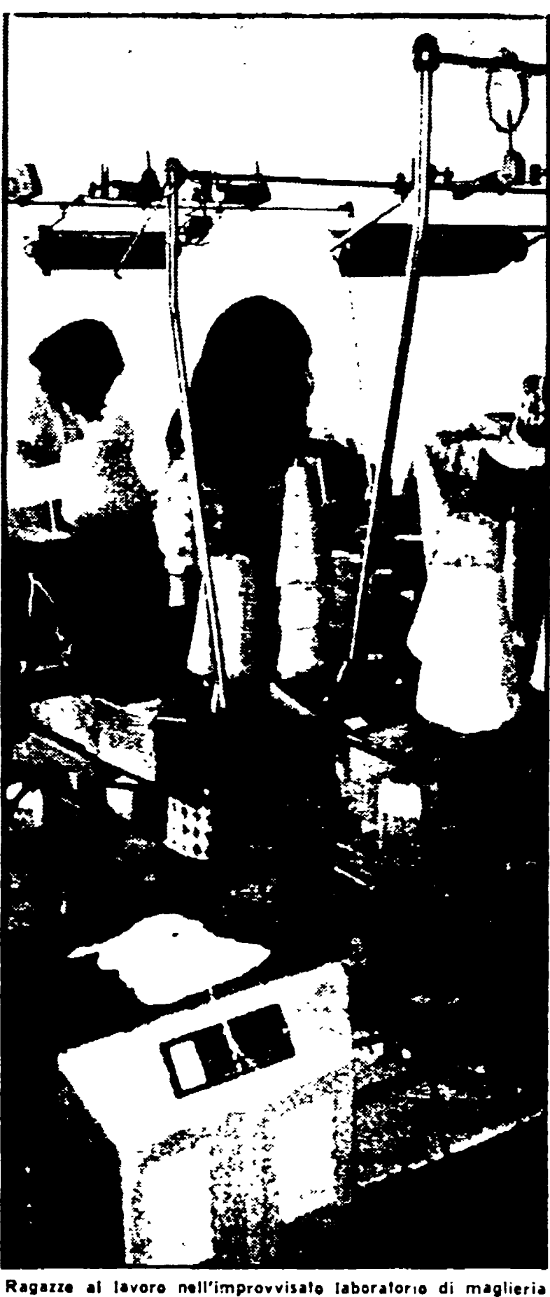
Ragazze al lavoro nell'improvvisato laboratorio di maglieria

LUCCA — Si è svolto il congresso provinciale della CGIL di Lucca. Il congresso è stato presieduto dal segretario provinciale e ha visto la partecipazione di numerosi delegati. A M. Carrara si è svolto il congresso provinciale della CGIL. Il congresso è stato presieduto dal segretario provinciale e ha visto la partecipazione di numerosi delegati.