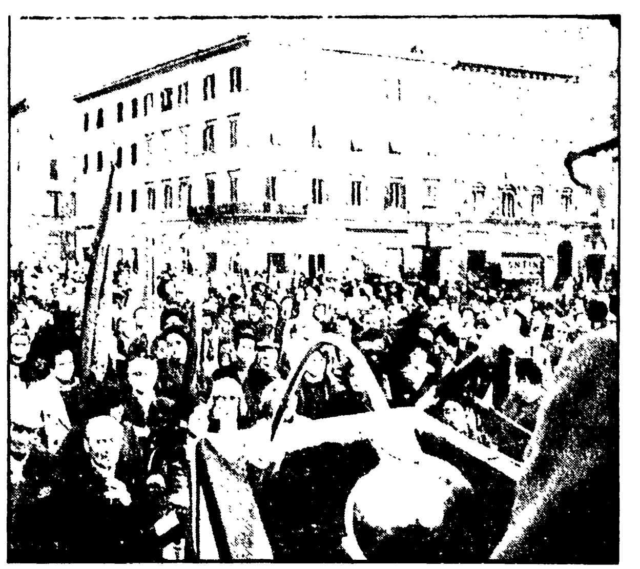
Manifestazione antifascista a Livorno

GROSSETO — La giunta comunale di Grosseto ha deciso nel corso di una conferenza stampa, tenutasi in aula consiliare, di approvare il regolamento sulla bozza indicativa di riorganizzazione del territorio comunale. La bozza, che prevede la suddivisione del territorio in otto quartieri, sarà sottoposta alla consultazione dei cittadini.