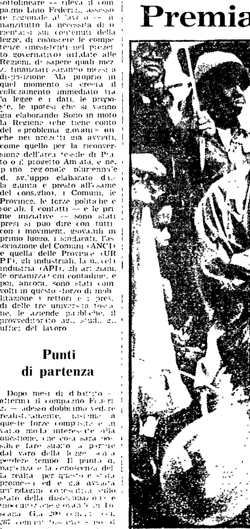
Questa fotografia ha ottenuto uno dei premi Pulitzer. Ritrae un veterano del Vietnam, che ha perso le gambe in guerra, col figlio in braccio. La foto è stata scattata da un reporter del «Chattanooga News Free Press» di nome Robin Hood.

Premiata col Pulitzer Questa fotografia ha ottenuto uno dei premi Pulitzer. Ritrae un veterano del Vietnam, che ha perso le gambe in guerra, col figlio in braccio. La foto è stata scattata da un reporter del «Chattanooga News Free Press» di nome Robin Hood.