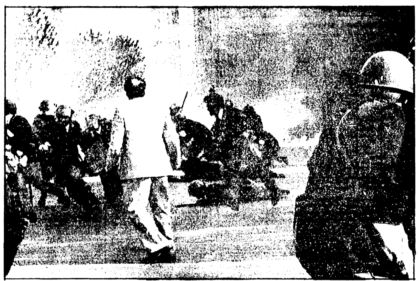
ROMA - Un'altra immagine del momento drammatico della sparatoria che ucciderà il sottufficiale Settimio Passamonti

ORE 16.20 - Le forze di polizia sono arrivate all'Università. I delinquenti hanno lanciato una daga di vetro e un oggetto di metallo che ha colpito un agente di polizia.