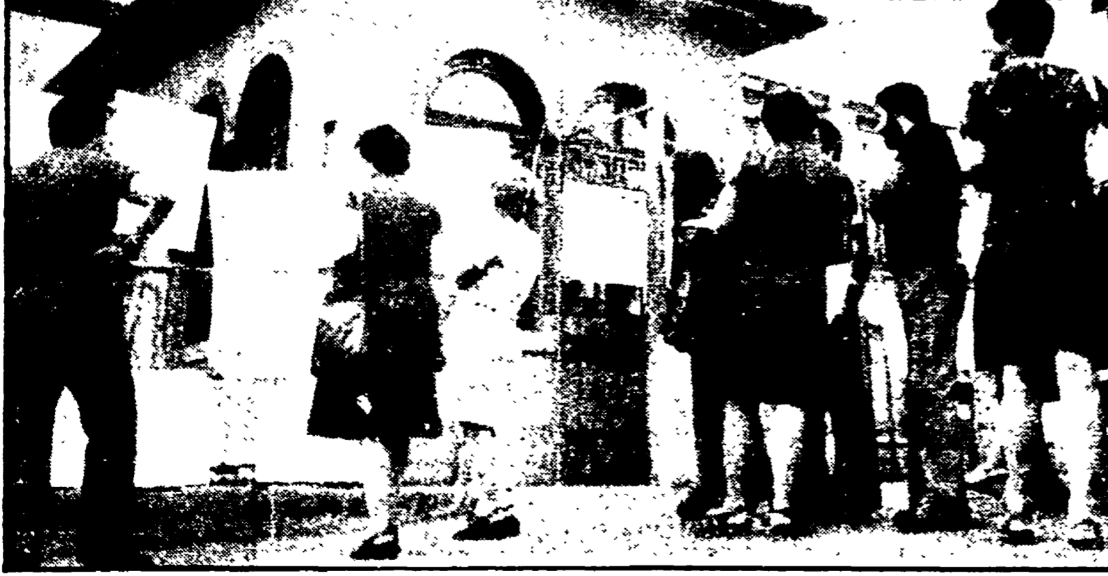
Gli operai della Cantoni Cucirini Coals di Lucca davanti allo stabilimento