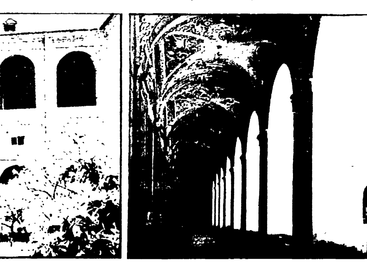
Nella foto accanto al titolo la capriata centrale del S. Michele a restauro ultimato. Nelle due foto in basso: il chiostro degli aranci e a destra, decorazioni e stucchi che ornano le volte dei portici.