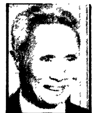
PHAM VAN DONG - Dopo trent'anni