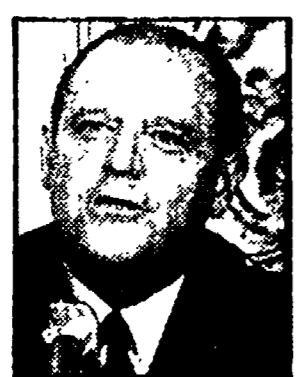
Estendere la cooperazione

«Uscito da una guerra tra le più distruttrici della storia e da oltre un secolo di dominazione imperialista...»