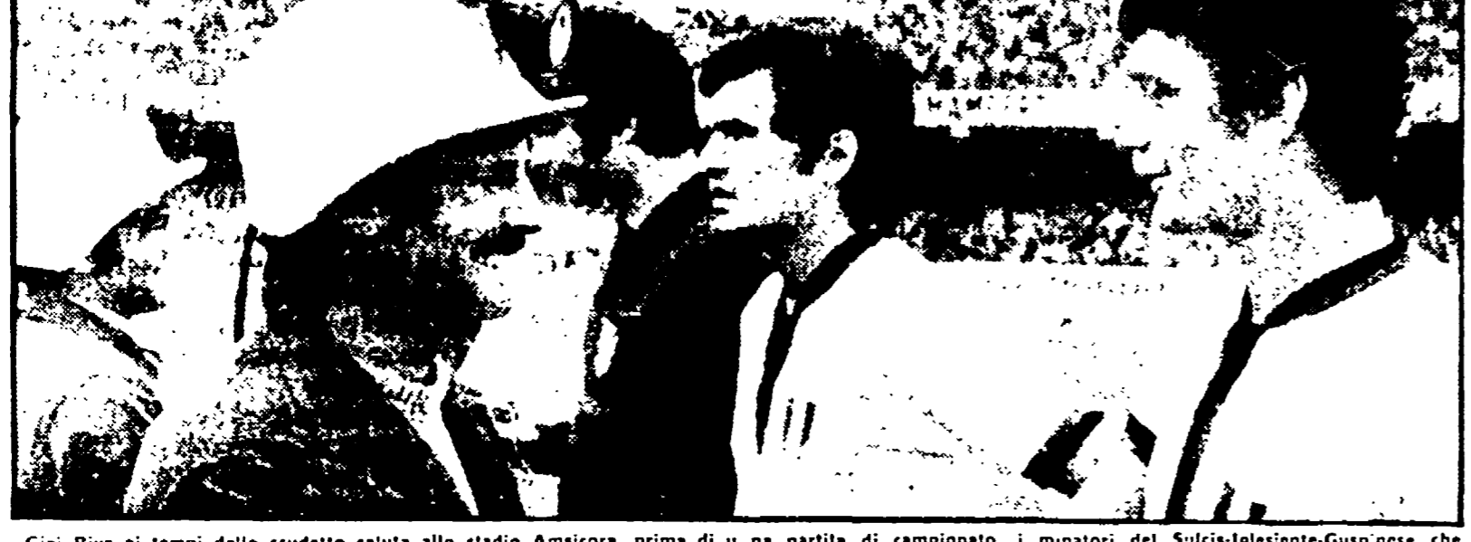
Gigi Riva al tempo dello scudetto saluta allo stadio Amisora, prima di una partita di campionato, i ministri del Sulcis-Iglesiente-Guspinese che avevano presenziato al pubblico le regioni della loro lotta per la riscossa della Sardegna. È stata quella l'unica volta che Riva ha esposto pubblicamente la sua solidarietà verso il mondo del lavoro.

La falsa immagine di un'intera regione in tanti davanti al suo idolo - Una scelta che spinge a considerare in termini meno consumistici i problemi dello sport