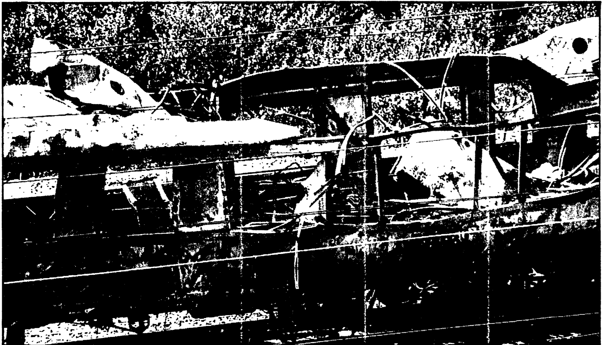
I resti del treno «Italicus» dopo l'attentato

Un esempio per tutti: come mai non si sono approfonditi i legami che univano i bombardieri del Fronte rivoluzionario e il MSI? I giudizi diametralmente opposti dei magistrati della città toscana e quelli di Bologna - Molti interrogativi aspettano risposta