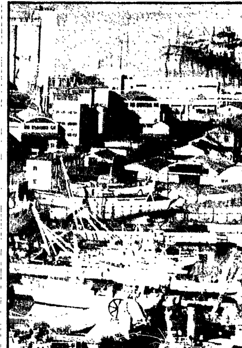
SI FERMA DOMANI PER QUATTRO ORE L'ATTIVITA' NEL PORTO DI ANCONA

ANCONA — L'inventario dei reperti archeologici del museo di Ascoli Piceno è stato compilato ed è stato consegnato al responsabile del museo. L'inventario è stato compilato ed è stato consegnato al responsabile del museo. L'inventario è stato compilato ed è stato consegnato al responsabile del museo.