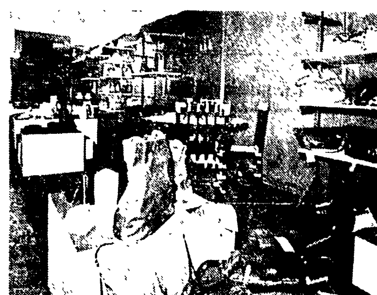
Stand delle Marche alla 41ª Mostra Internazionale dell'Artigianato di Firenze.

Tutta la produzione della ditta GALLI è imperniata su uno standard produttivo altamente qualificato come conseguenza di ricerche, di sperimentazioni e di una trentennale esperienza ed è perciò largamente richiesta in Italia e in vari paesi d'Europa e d'America.