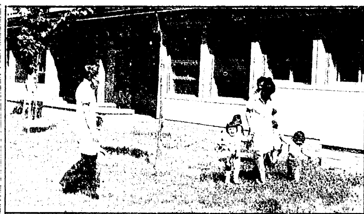
Bimbi e assistenti nel pinto dell'asilo nido di Casal Bruciato

Entro il '77 saranno in funzione in tutta la città 140 asili nido, per un totale di 8.500 posti-bambini. Novecento esatta gli a settembre saranno pronti ad accogliere i piccoli, fino a tre anni di età.