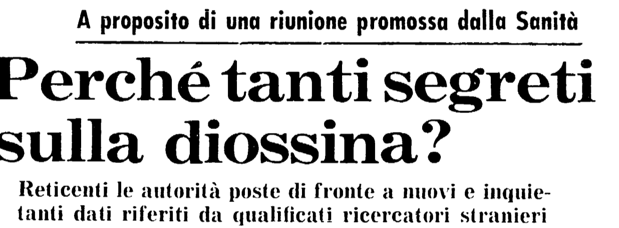
Perché tanti segreti sulla diossina?

Lo scatto per delineare un profilo documentato e sconcertante, di diplomazia, è stata fornita da un recente articolo del Corriere della Sera, in cui si richiama l'attenzione su un certo esempio di gestione della missione diplomatica turca, cui si richiama l'attenzione del ministro Pieralli.