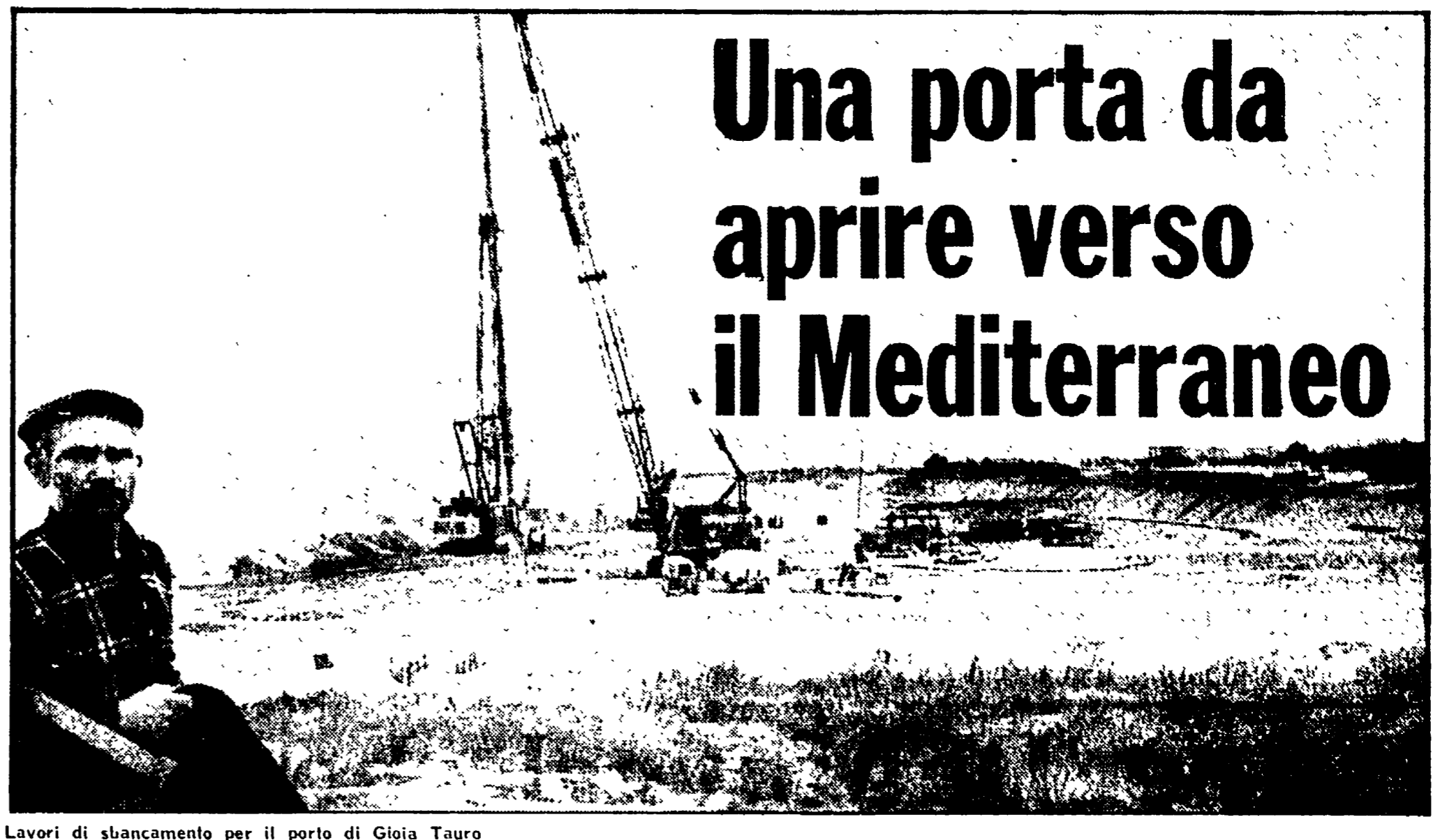
Lavori di sbancamento per il porto di Gioia Tauro