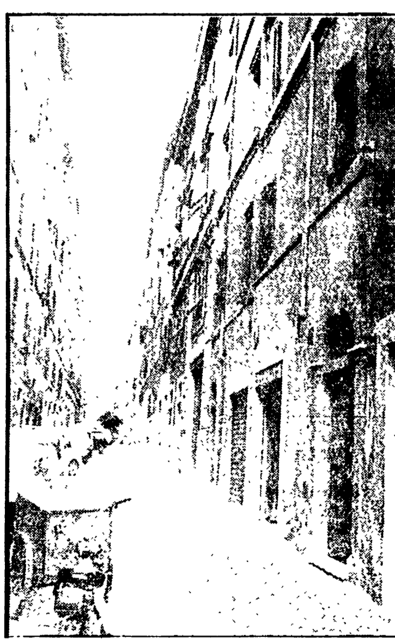
L'edificio di via Baccina che diventerà un centro per anziani

Le due sottostazioni dell'azienda tranviaria sono nei vecchi rioni del centro — Inutilizzate da anni le strutture di via Baccina e via di Monte Brianzo. Qui troverà posto un'esposizione dell'artigianato