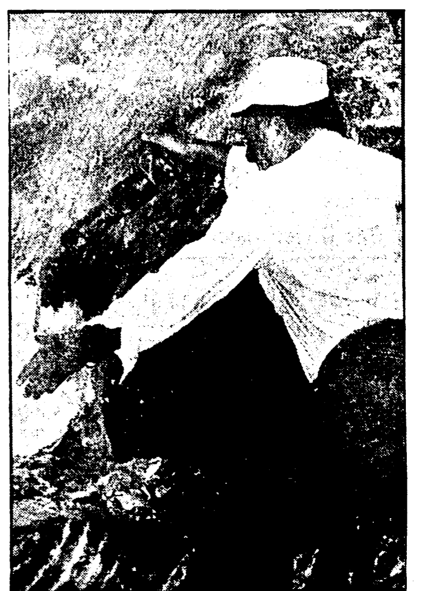
Un minatore in una cava di alabastro mentre estrae l'ovulo

Scoperti poco distanti nuovi giacimenti - Cassa integrazione per gli operai - Convenzione col comune