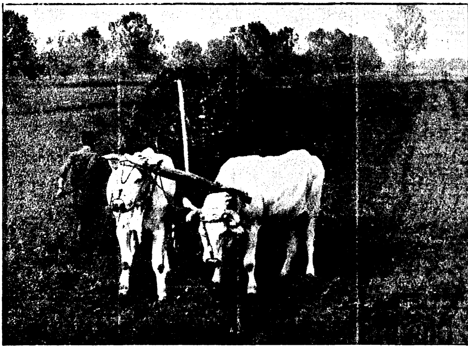
Per il rilancio delle campagne e delle aziende che operano nel settore non è più rinviabile l'ammmodernamento e la ristrutturazione degli impianti

PISA - Una delle questioni fondamentali attorno alla quale si svilupperà il dibattito sulla Seconda Conferenza regionale sull'agricoltura sarà quella della competitività delle aziende agricole e dell'equazione del reddito dei lavoratori della terra con quello degli addetti all'industria. Nel corso di un recente convegno che si è svolto nell'aula magna della università di Pisa, l'assessore Anselmo Pucci, concorda con il dibattito che dice che il problema della ristrutturazione delle aziende agricole, per renderle competitive, si sarebbe posto ugualmente in Toscana se non ci fossero state le direttive della CEE. In un regime di mercato, infatti, nessuna attività economica - e quindi nemmeno quella agricola - può ritenersi produttiva se non riesce a competere sul mercato con i prodotti che sono competitivi con quelli delle aziende degli altri paesi. Inoltre, se si vuole arrivare a risolvere il problema della carenza di manodopera giovane e qualificata nelle campagne, sarà necessario non solo attrarre ai lavoratori della terra un migliore sistema di vita, attraverso adeguate infrastrutture, ma anche equiparare il reddito degli addetti a quello dei lavoratori dell'industria.