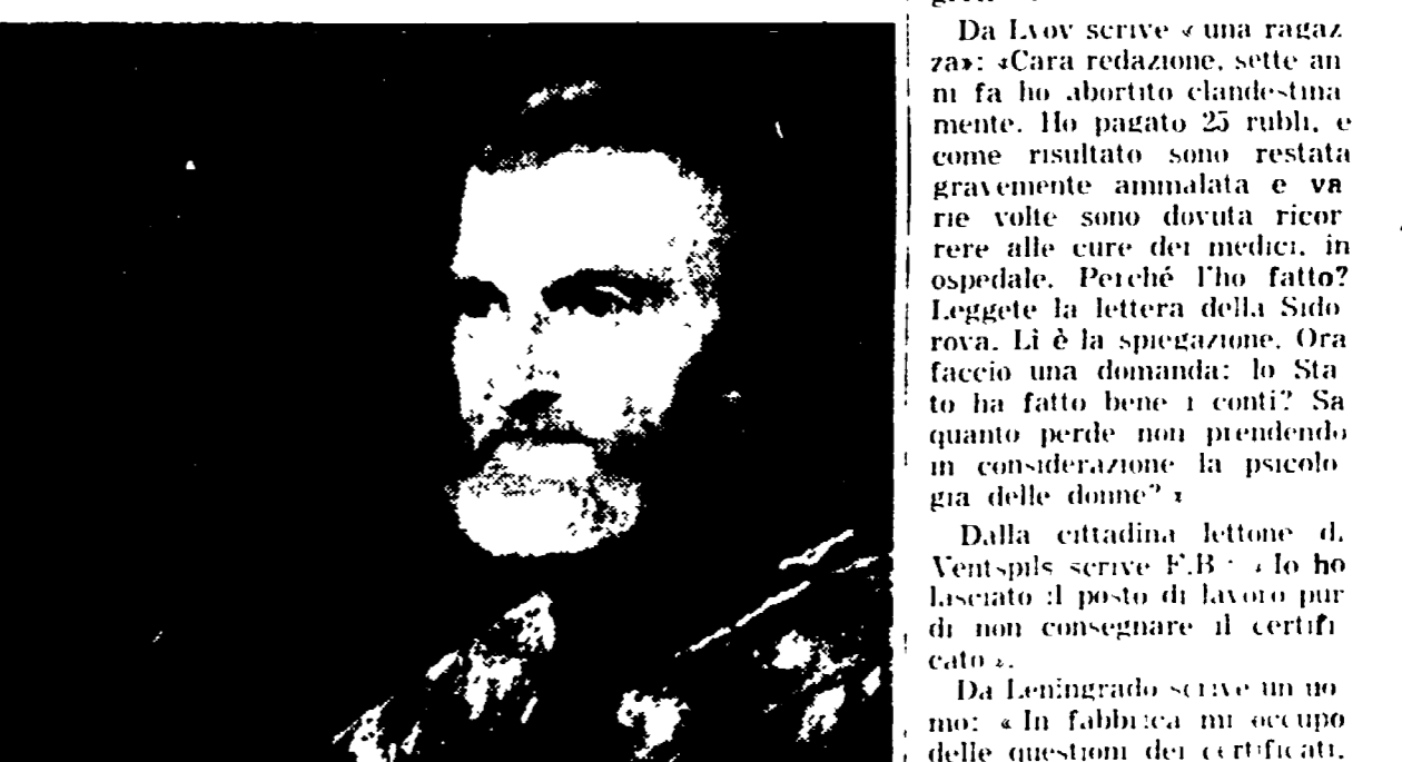
«Ritratto di vecchio guerriero» di Tiziano

«Da Livio scriveva una ragazza: «Caro redazione, sette anni fa ho abortito clandestinamente...»