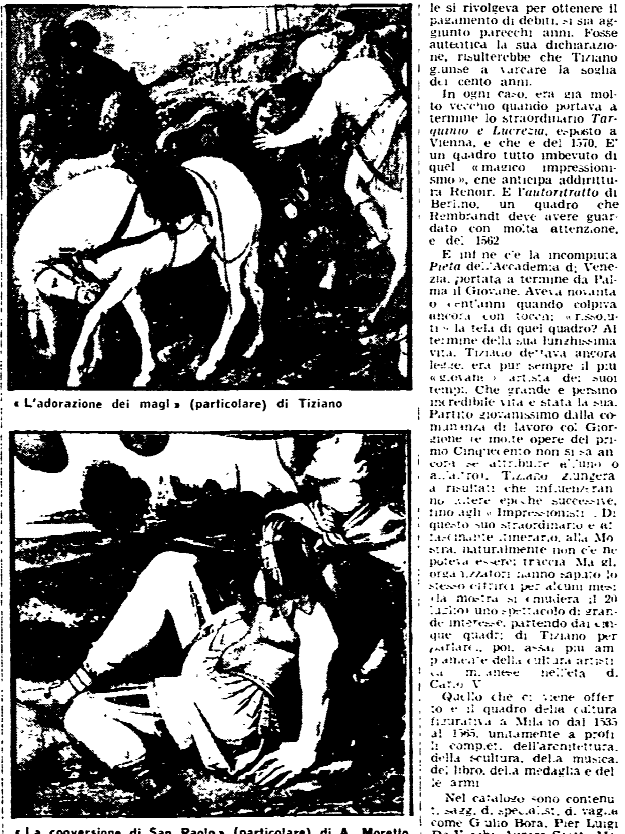
«L'adorazione dei magi» (particolare) di Tiziano