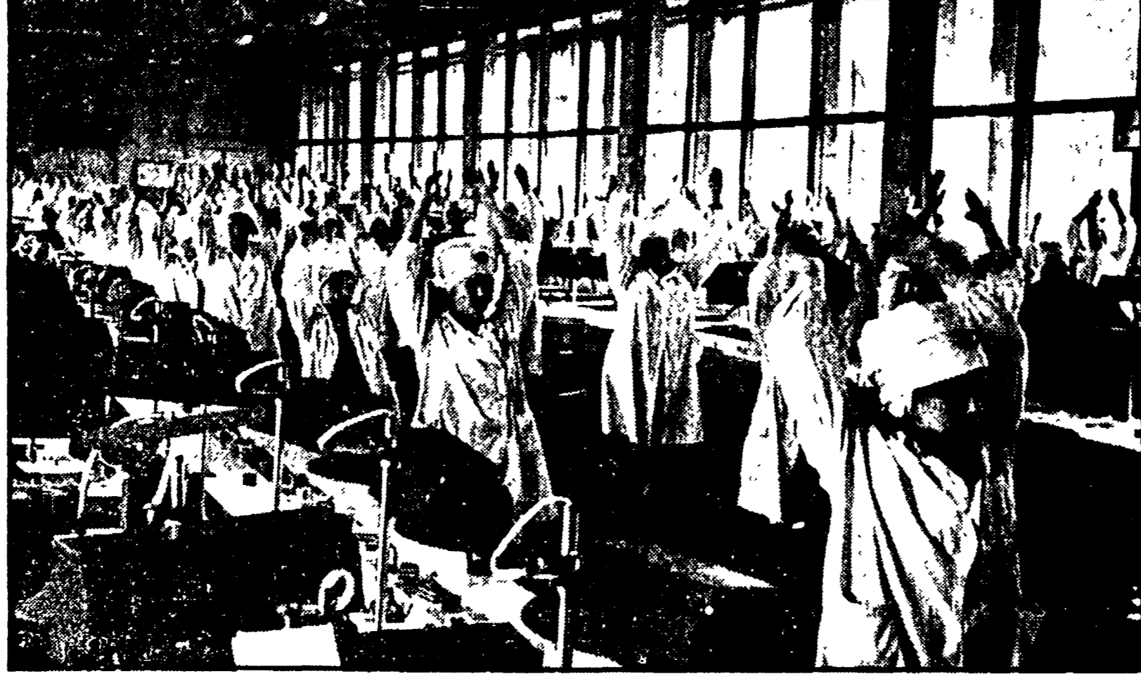
Una pausa di ginnastica in uno stabilimento industriale sovietico

«Caro Fortebraccio... la storia, per il momento, finisce qui...»