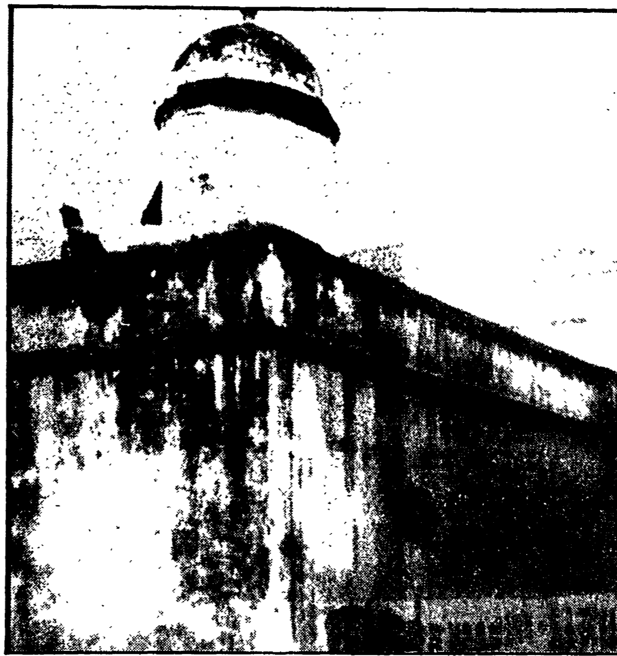
Uno scorcio del carcere di Catania nel quale vengono ospitati anche detenuti minorenni. «Usati» come manovalanza della malavita della città, sono spesso i più giovani a rimetterci la vita nei regolamenti di conti tra bande rivali