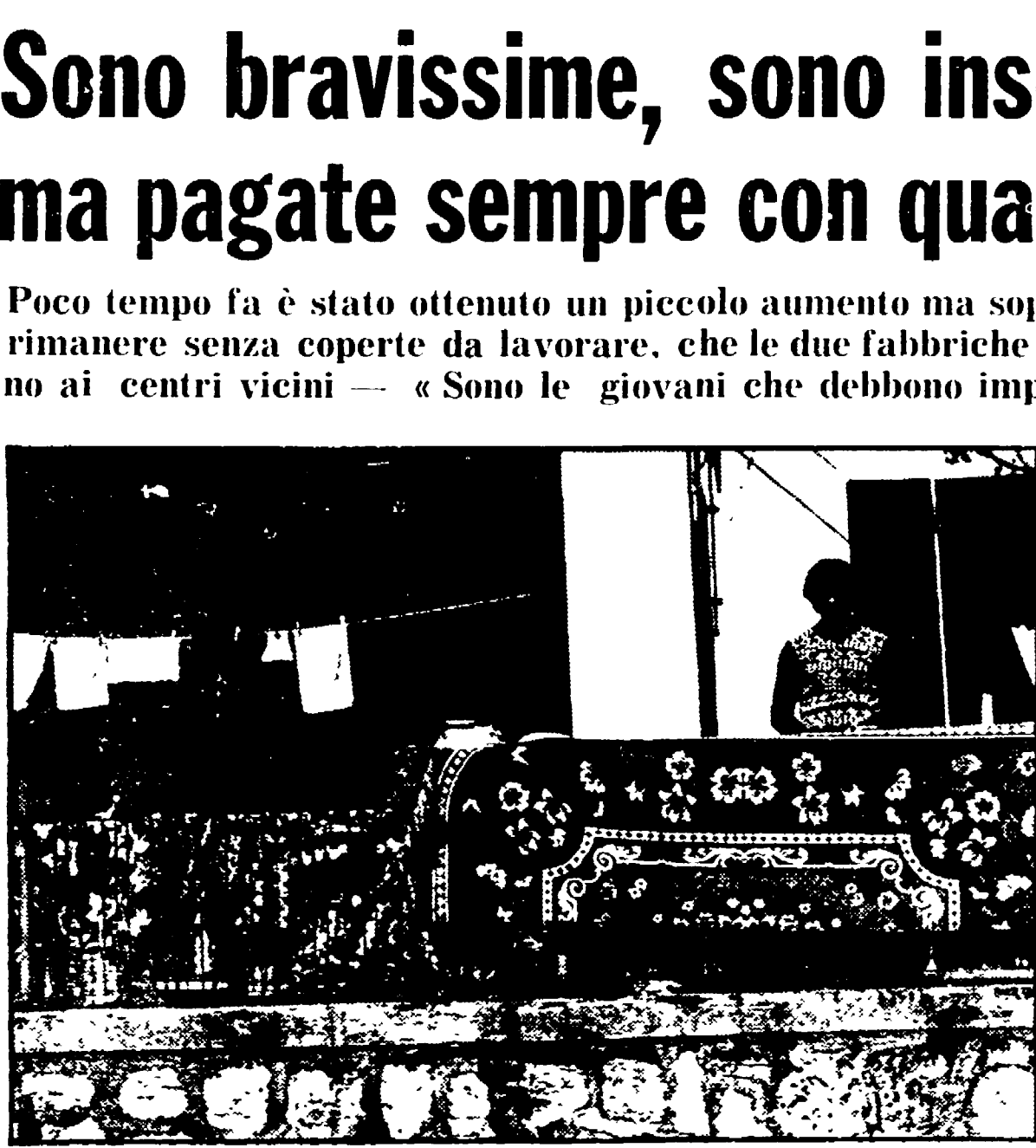
TARANTA PELIGNA — Le coperte alle quali le lavoranti debbono legare le frange; non c'è macchina capace di farlo con la loro abilità e la loro bravura

TARANTA PELIGNA — La vita è dura per le lavoratrici... «Sono le giovani che debbono imparare a ribellarsi...»