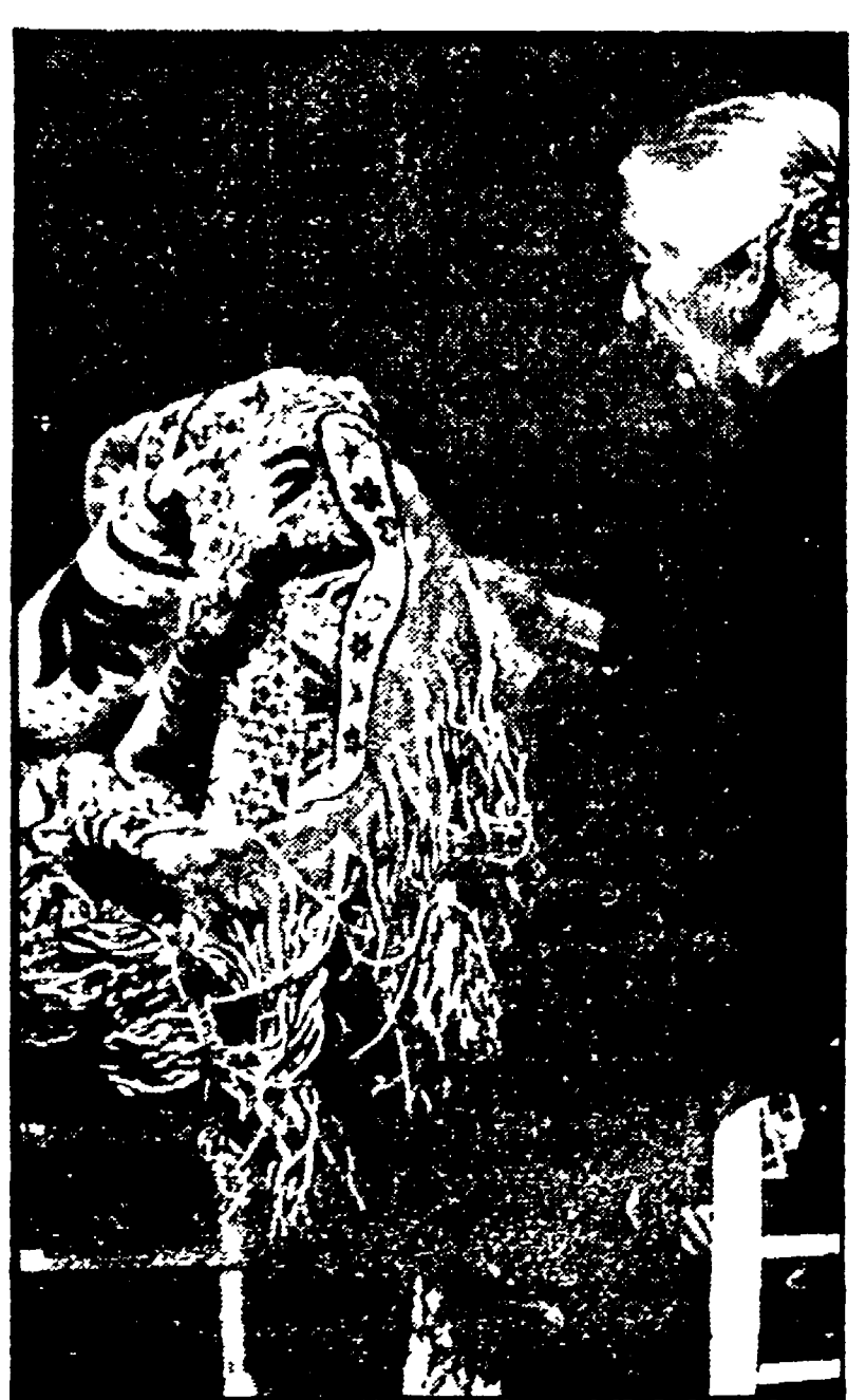
TARANTA PELIGNA — Un'anziana lavorante mentre allaga le frange alle coperte

Il processo per la rapina di Avezzano... «Rimase uccisi un orfice e il figlio...»