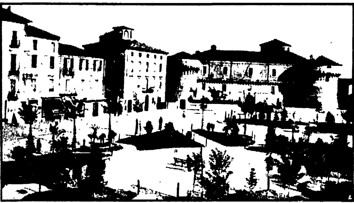
AVEZZANO — Piazza Castello e il complesso medievale in due immagini antecedenti il sisma del 1915.